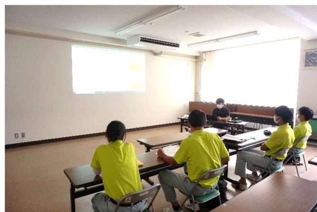
9時から夕方5時まで、お疲れ様でした