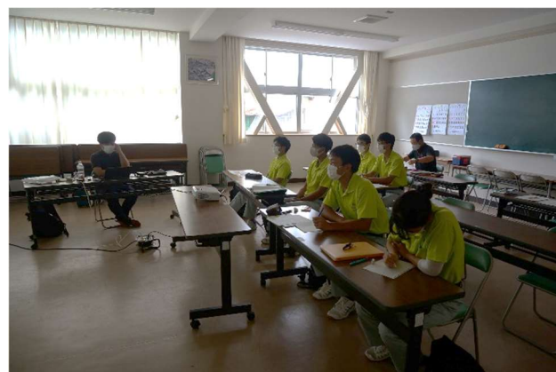
農場の課題を必死にメモします