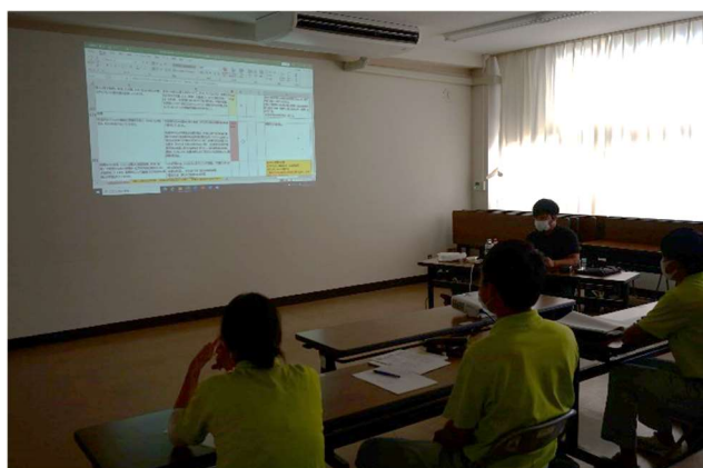
項目ごとに達成をチェック