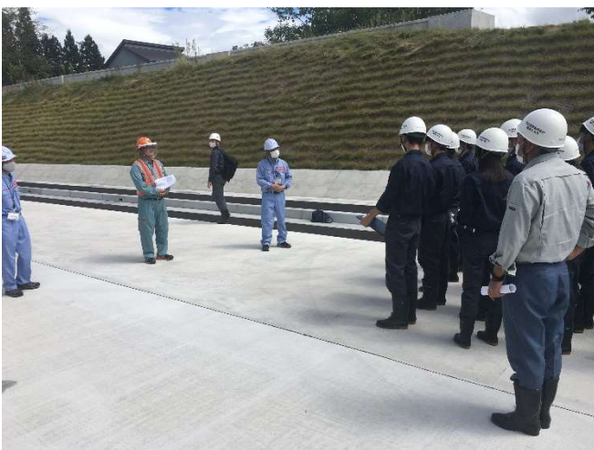
連続鉄筋コンクリート舗装の説明