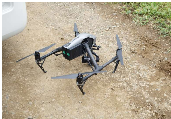
ドローン操作の体験