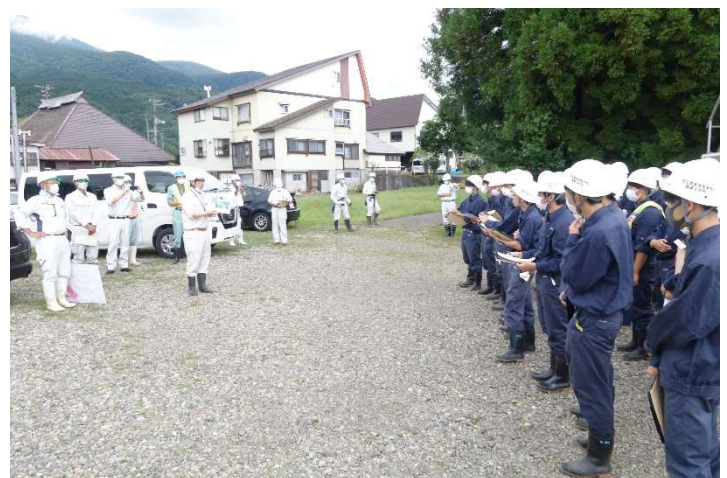
杉野沢地区ほ場整備の説明