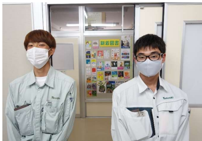
昨年度の卒業生も参加してくれました