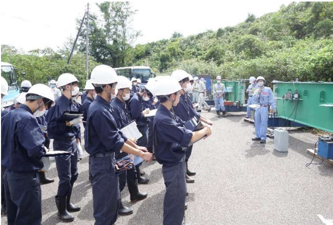
妙高大橋での説明

11日は、本校で「働く」ことについて講義を受け、8班に分かれて、ディスカッションを行いました。そこでは、職業の選択方法等について質疑応答を行いながら、今後の進路選択の参考にすることができました。