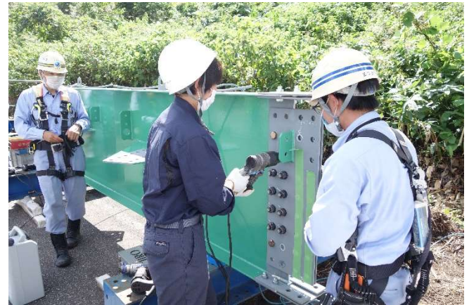
ボルトの締め付け体験