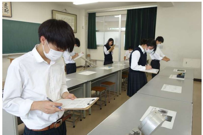
生徒が問題を解答している様子